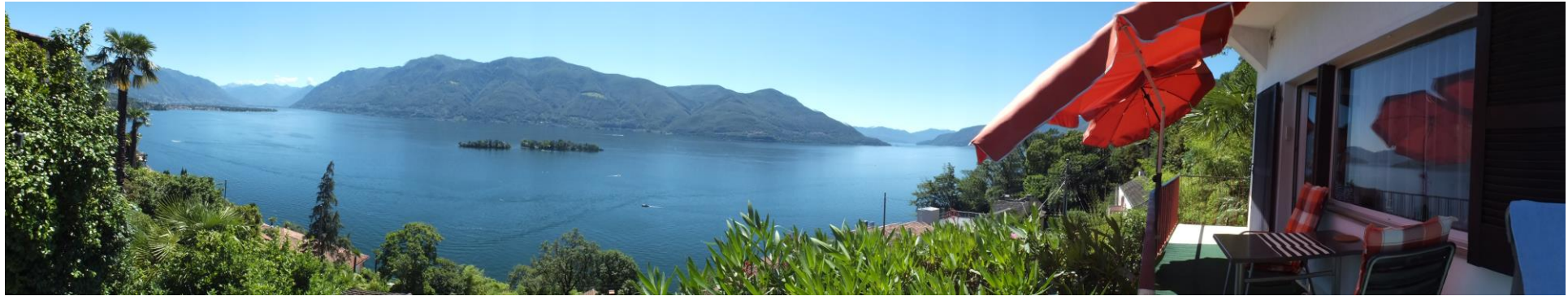
Rundblick von der Casa Viola Ascona